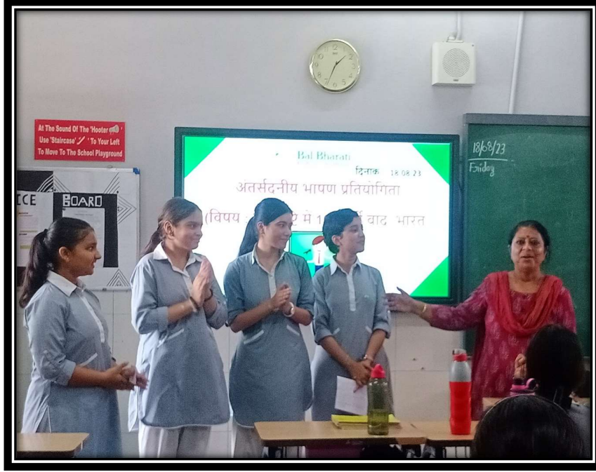
गुरु-ज्ञान की उत्कट अभिलाषा

Sector - 21, Noida Phone : 0120-2534064, 2538533 / E-mail : bbpsed@balbharati.org Website : http://bbpsnoida.balbharati.org