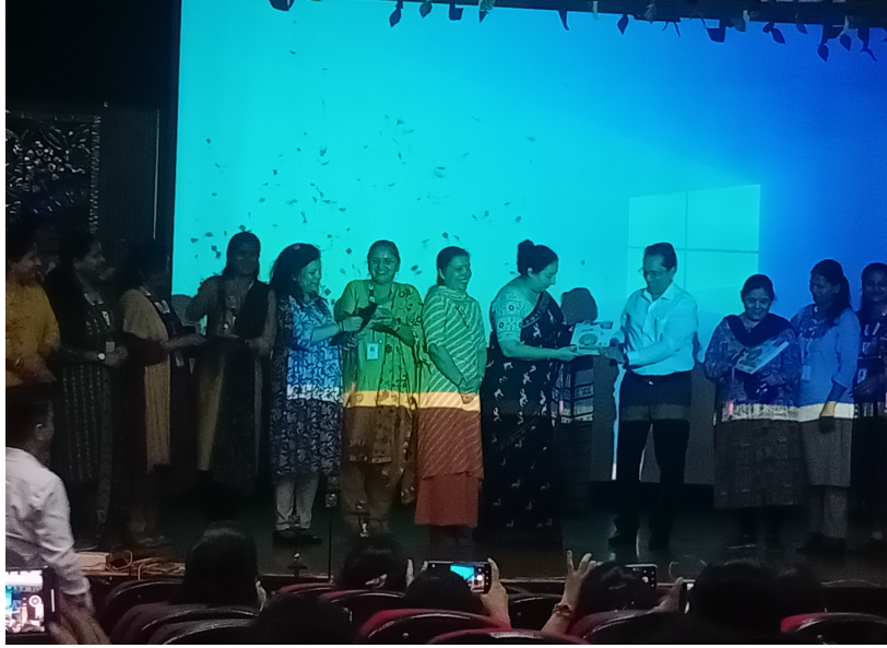
पुस्तक-विमोचन : हर्ष के पल