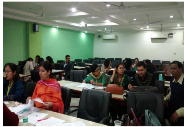
कार्य में तल्लीनता